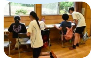
▼小学生の学習支援