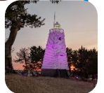
▲R7 六角灯台ライトアップ