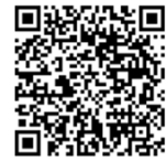
▲庄内こころ塾ホームページ

心理学を学び、日常に応用することで、悩みや不安に適切に自分で対処できるようになるため、上記の事業を通して、一般社会人の心理学初心者に興味を持ってもらい、日常生活に使える技術を身につけてもらいます。