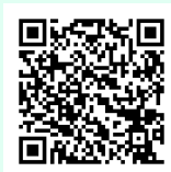
▲申込はこちらから

問合せ: Peppers (waft hair & make 内) 0234-23-2651