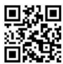
ボラポートさかた ホームページ