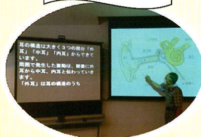
全体投影(パソコン)

要約筆記は 聞こえない人・ 聞こえにくい人に、 その場の話をも文字で 伝える通訳です。