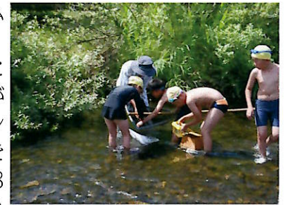
▲箱眼鏡や網で生態観察