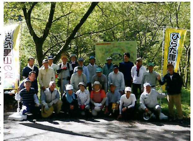
▲猛暑の中、頑張りました！

ボランティア参加者は27人は、遊歩道の草刈りと枝切り、水汲みの滝前の雑木を伐採、経ヶ藏山登山道入口の草刈りの3グループに分かれて作業しました。今回の整備で水汲み滝に下ることが容易になり、滝の落ち口まで見通しも良くなりました。