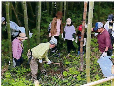
▲参加者にタケノコ採り指導

山楯竹林整備と当会の活動を多くの人に知ってもらい、会員らの交流を図るため、5月13日「春の森の感謝祭」を開催しました。