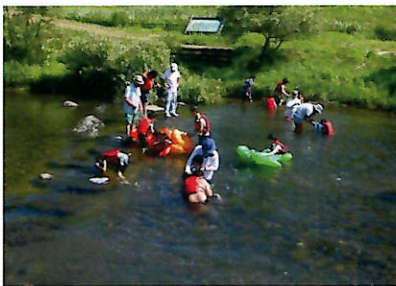
▲救命胴衣を着てゆったり遊泳

10日に梅の香りを楽しみながら「南麓おばこ梅収穫体験」、22日は(一社)ドリームやまがた里山プロジェクト主催の西浜海岸バリアフリービーチイベントで海水浴、27日は当会会員サポートによる「水辺の楽校」で川遊びをして夏の思い出を作りました。