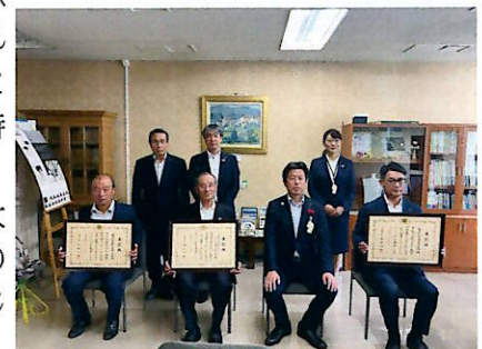
▲山形県庁にて大臣と記念撮影