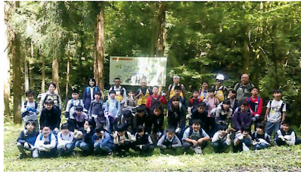
▲経ヶ藏山登山に挑戦した南平田小4年生

6/30黒森小学校は3、4、5年生20名は雨天のため学習センターでのモルック体験に変更。学年混合チームに分かれて対戦した子どもたちは早く50点到達を目指すゲームに白熱していました。