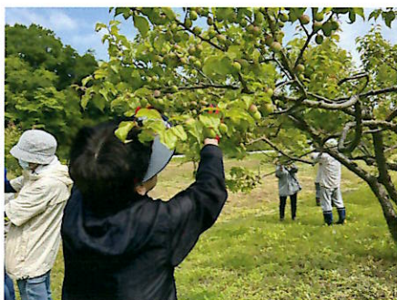
▲小さな実をそっと摘まんで

5/27、6/10は梅の実を大きくするための摘果作業(実と実の間隔を4cmに空ける)の参加者は2日間で27人でした。