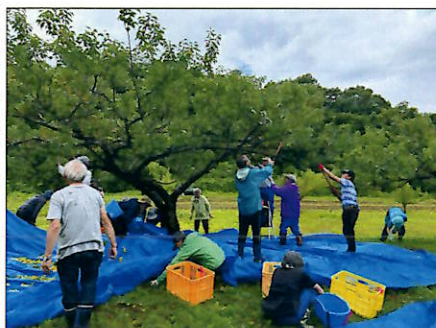
▲実を落として収穫

7/8会員や一般参加者を募り31人で収穫作業を実施しました。収穫は梅の下にブルーシートを敷いて木を揺さぶり、落ちた梅の実を袋詰めする手順で行い、総重量310kgの梅が収穫、格安販売しました。