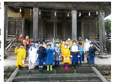
▲クラブ部員17人で神社参拝