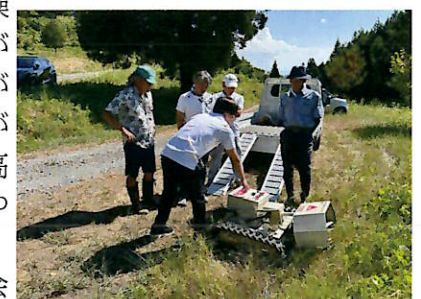
▲操作方法を学んで試運転