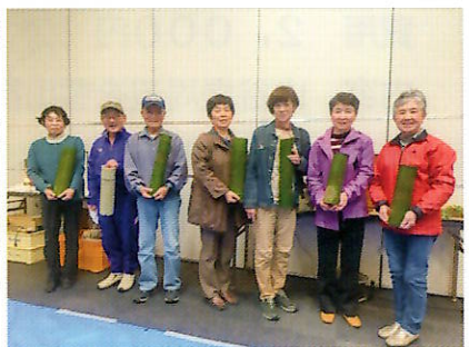
▲それぞれの作品と一緒に