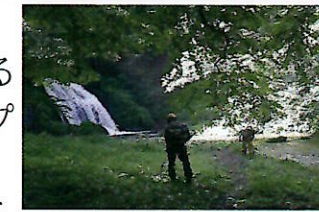
▲滝周辺も念入り草刈り

8月21日(土)、酒田市の景観地である十二滝と茶屋駐車場をブラッシュアップする「十二滝整備ボランティア」を実施。酒田市、庄内町、遊佐町、鶴岡市から40名が集結。残暑の中、草刈り、ツル切り、土砂撤去や看板修繕など手分けして作業実施。予定の作業は順調に進み、参加者同志の交流と綺麗に整備した遊歩道をかみしめながら十二滝も散策をした。