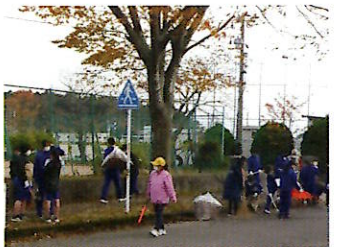
▲東部中前、わたなべ道