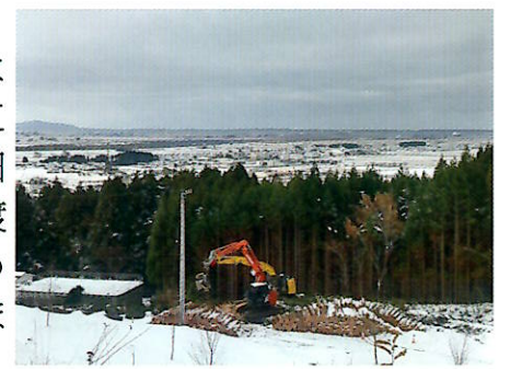
▲是非みはらし台にいらっしやい

酒田市に要望していた悠々の杜みはらし台からの眺望を阻害していた杉の伐採工事は12月17日に完了しました。これにより西側に広く酒田市を見渡せるようになりました。