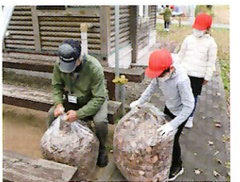
▲飛鳥グランドゴルフ場

地域住民が前もって袋詰めあり、約180袋集まりました。回収した落ち葉は当会の定例ボランティア活動で、堆肥箱にケヤキとそれ以外の葉に分け、来年の腐葉土づくりの準備をしました。