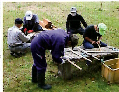
▲竹の靴ベラを念入りに磨く