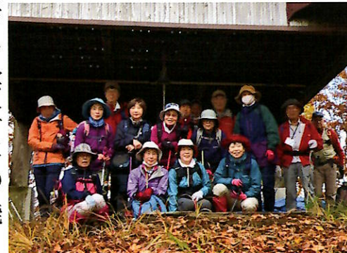
▲山頂で記念の一枚

前日まで雨でしたが、参加者は景色や高山植物の話をしながらか登山道を進み、頂上と須弥壇岩まで到達しました。雲で鳥海山は隠れていたが、崖下の紅葉を堪能しました。ゆっくり休憩してからの下山は足取り軽く、登山口に到着した時には達成感で溢れていました。