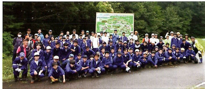
▲作業終了後、遊歩道前広場で記念撮影