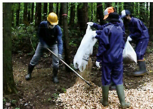
▲チップ敷きは効率よく運搬