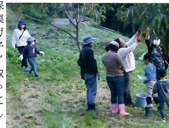
▲はじめての栗収穫に大はしゃぎ

10月6日(木)、悠々の杜にて放課後等デイサービスを利用している子供たちが栗拾いをしました。副代表と保育士さんが栗の木からイガを落とすと子どもたちはイガから栗を取り出してはしゃいでバケツに集めていました。