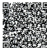
やまがたe申請（法人・団体）