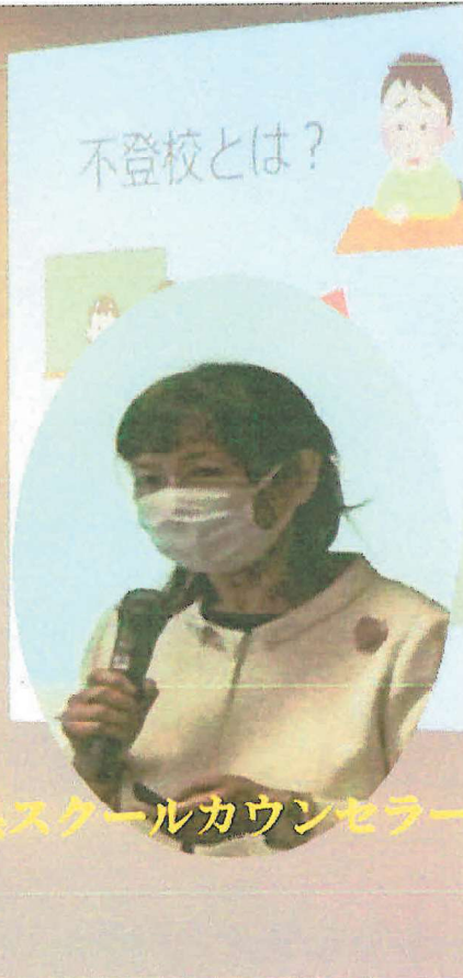
山形県スクールカウンセラー