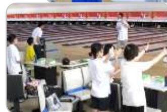
スペシャルオリンピックス 日本・山形 酒田支部