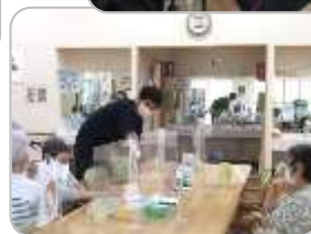
パワーリハティ サービス酒田