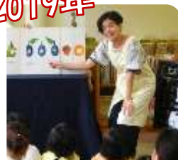
絵本の読み聞かせ