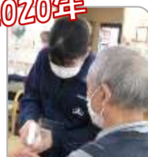
高齢の方との交流