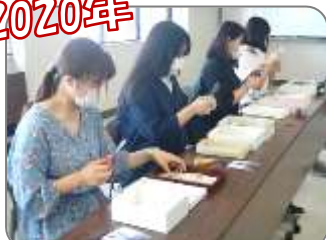
使用済み切手で海外支援