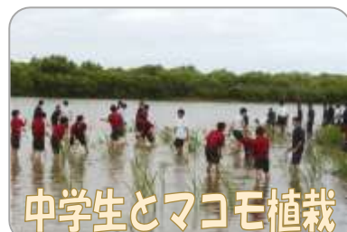
中学生とマコモ植栽

地域の児童や生徒、保護者とともに、白鳥の愛護活動、環境整備活動などを長年にわたり継続している功績を称えられての表彰となりました。白鳥の自然食であるマコモを植栽するなど、息の長い活動を続けられています。