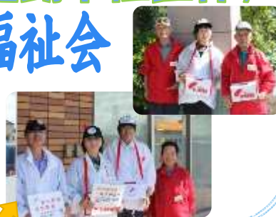
街頭での募金活動

共同募金の活動開始となる10月の第1日曜日に、街頭及びイベント会場等での募金活動協力をするなど、長年にわたり共同募金運動への多大な貢献をしている功績を称えられての表彰となりました。おめでとうございます。