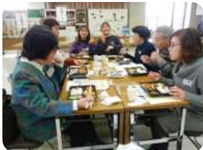
軽食をとりながらワイワイ 楽しく情報交換♪

2月1日(土) 地域福祉センターにて、ボランティア・市民活動交流会を開催し、23団体6個人 62名の方からご参加いただきました。