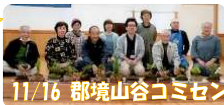
11/16 郡境山谷コミセン