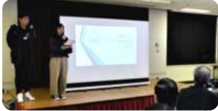
1団体2分30分の持ち時間内で活動紹介をしました(^O^)