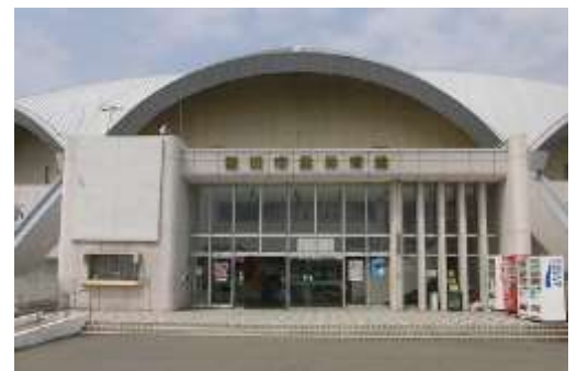
酒田市体育館正面