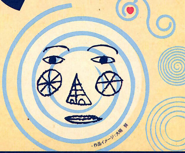
作品イメージ: 本間 勇