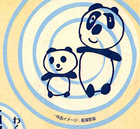
作品イメージ: 長濱哲哉