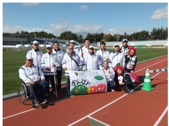
最上川大会に出場した6選手が全国障害者スポーツ大会で大活躍しました。