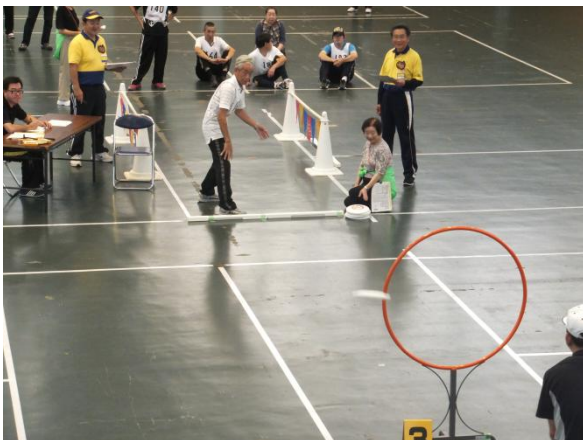
酒田市体育館で開催