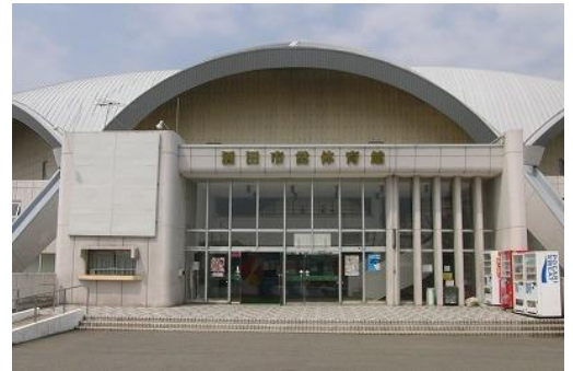
酒田市体育館正面