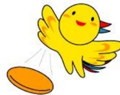
全国障害者スポーツ大会 いわて大会