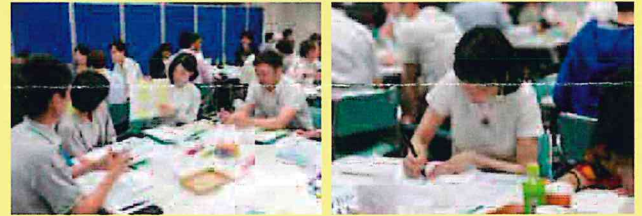
組織の課題を深掘りしながら、課題の根本を捉えるワークを行います。

定員 40名 資料代 1,000円 (1名につき) ※日本NPOセンターの会員は800円 (1名につき)