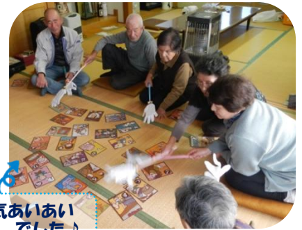
和気あいあい でした♪

http://sakata-hogen.com/database/ 問 TEL:22-4477