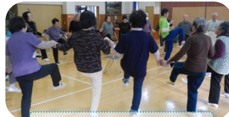
11/6 西荒瀬コミセンにて♪

今年度の『ボランティア・市民活動交流会』は平成28年2月20日（土）の予定です！！詳しくはボラセンまで。