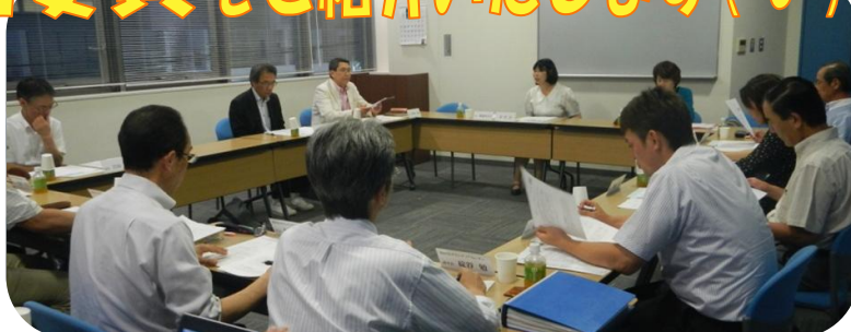
6/25 今年度1回目の運営委員会